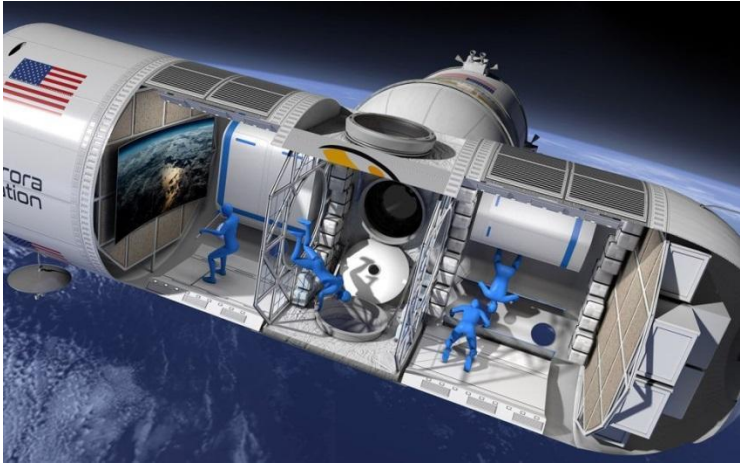
Fig. 1. Aurora Station the first luxury space hotel [Orion Span, 2018]